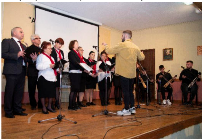
Η χορωδία του συλλόγου καλωσόρισε τους παρευρισκόμενους με παραδοσιακά κάλαντα απ' όλη την Ελλάδα.