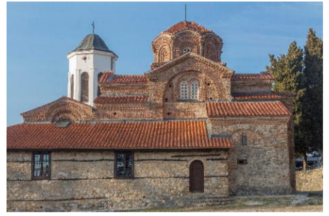
7. ΠΑΝΑΓΙΑ ΠΕΡΙΒΛΕΠΤΟΣ

φάνεια, 248 τ.χλμ. ανήκουν στη Βόρεια Μακεδονία και 110 τ.χλμ. στην Αλβανία.