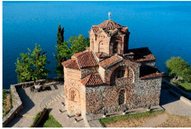
2. ΑΓΙΟΣ ΙΩΑΝΝΗΣ ΤΟΥ ΚΑΝΕΟ