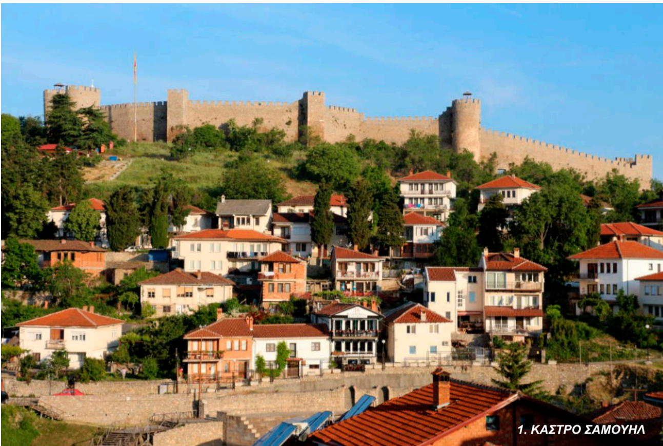
1. ΚΑΣΤΡΟ ΣΑΜΟΥΥΛΑ