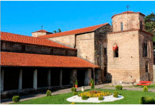
8. ΑΓΙΑ ΣΟΦΙΑ