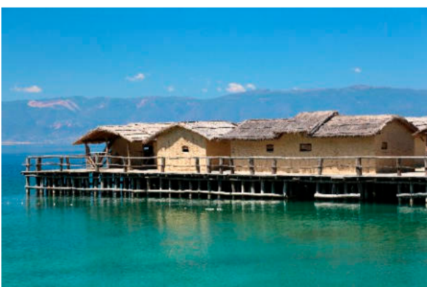
9. Νεολιθικό - πλωτό οικισμό Gradiste

9 Η λίμνη, η παραλίμνια βόλτα και η κρουαζιέρα: Κεντρική πρωταγωνίστρια στην περιοχή είναι η ομώνυμη λίμνη, από τους δημοφιλέστερους προορισμούς της χώρας. Δίκαια η λίμνη Οχρίδα κερδίζει τον τίτλο της Θάλασσας Γλυκού Νερού, όχι μόνο λόγω του καταγάλανων νερών της – απόλυτα διαυγή, με καθαρότητα που φτάνει τα 20 μ. βάθος το χειμώνα-, αλλά και εξαιτίας της έκτασής της, που παραπέμπει σε θάλασσα, καλύπτοντας 358 τετρ. χλμ. με βάθος 294 μ.