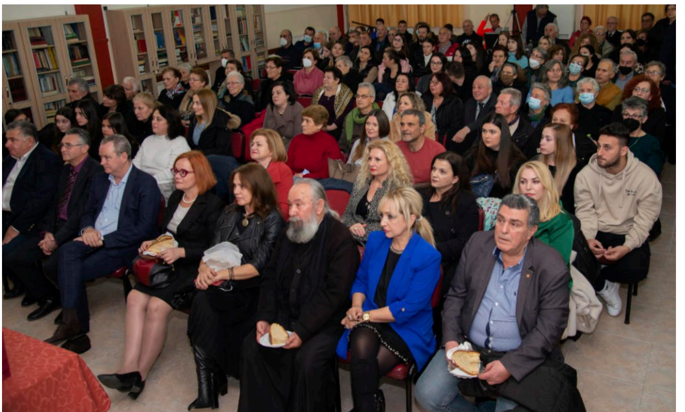
Αποψη του κόσμου που παραβρέθηκε στην εκδήλωση.