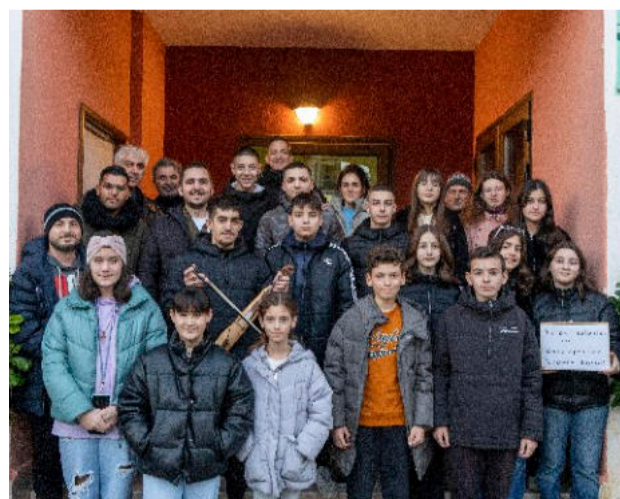
Μικροί και μεγάλοι έτοιμοι για να ψάλλουν τα παραδοσιακά Οφίτικα Κάλαντα σε όλα τα σπίτια των Οφιτών στη Νέα Τραπεζούντα και την Κατερίνη.

Το Διοικητικό Συμβούλιο του συλλόγου ευχαριστεί θερμά όλους που άνοιξαν με αγάπη και καλοσύνη τις πόρτες των σπιτιών τους στους καλαντάρηδες, και όλους μι-