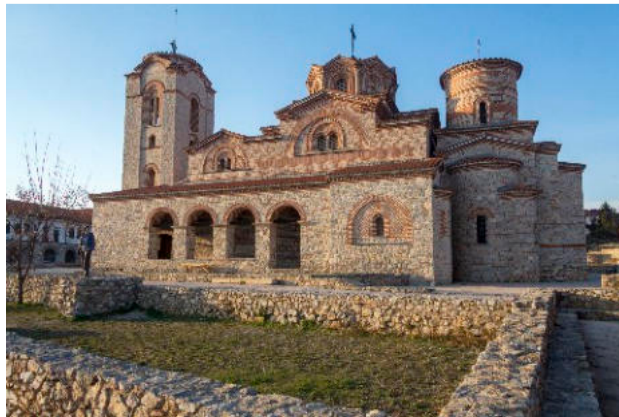
6. Μονή Αγ. Παντελεήμονα